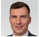
Oskar Lipp AfD